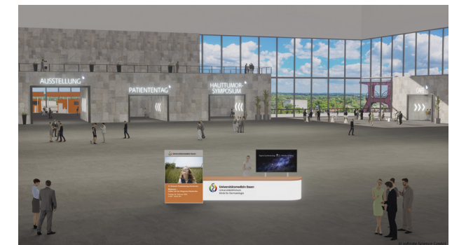
Digitales Foyer des 13. Essener Hauttumorsymposiums